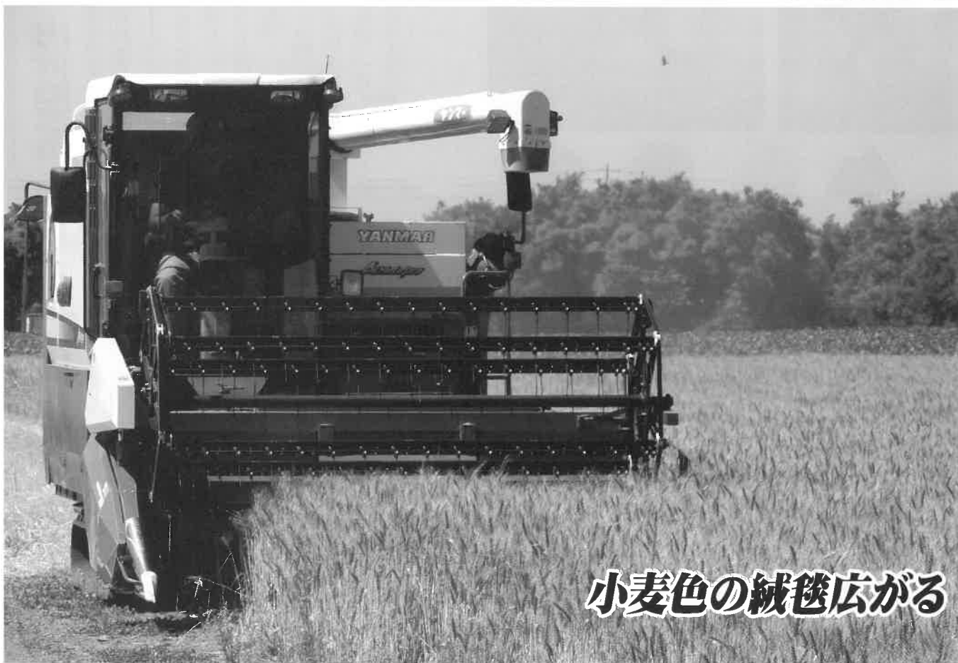
小麦色の絨毯広がる