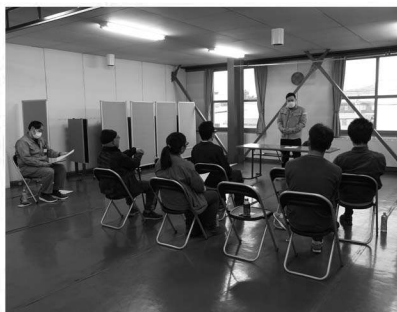
写真は総会後の ヘルパー講習会の様子