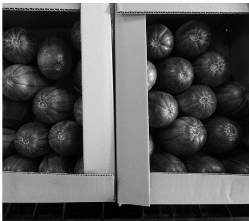
出荷された北海カンロ