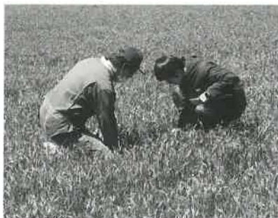
普及員の説明を聞く (有) アクティブ4社員