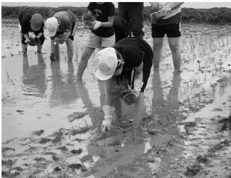
真剣に田植えをする月形小学校5年生

然環境の大切さに対して関心を持っていただけのように、今後も継続して取り組んで参ります。