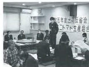
ミニトマト反省会