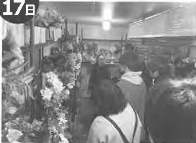
月形花き生産組合青年部出荷反省会