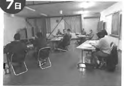
JA北海道大会フォーラムWEB開催