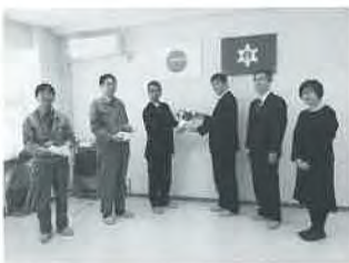
令和5年月形花き生産組合出荷反省会