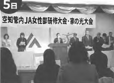
空知管内JA女性部研修大会・家の光大会