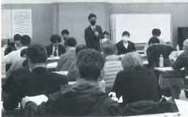
月形花き生産組合