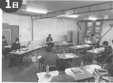
月形花き生産組合スターチス・ 草花部会合同品種説明会