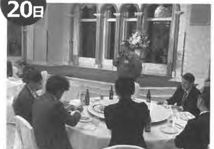
北海道花き生産流通セミナー