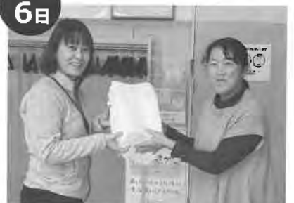
女性部 月形町社会福祉協議会へ雑巾寄贈