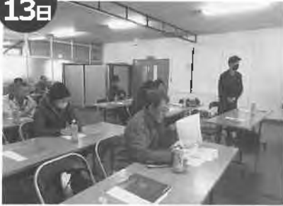
月形花き生産組合UVBライト講習会