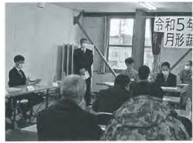
月形野菜生産組合