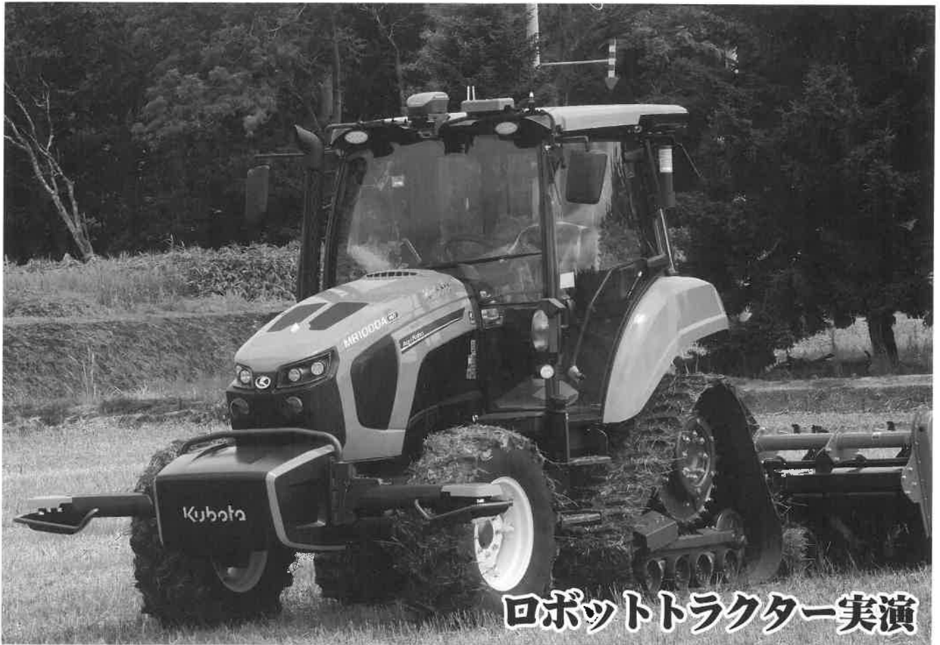
ロボットトラクター実演