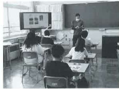
米について説明する青年部役員

J A 月形町青年部は、月形小学校5年生の児童を対象に「食育」授業を開催しました。