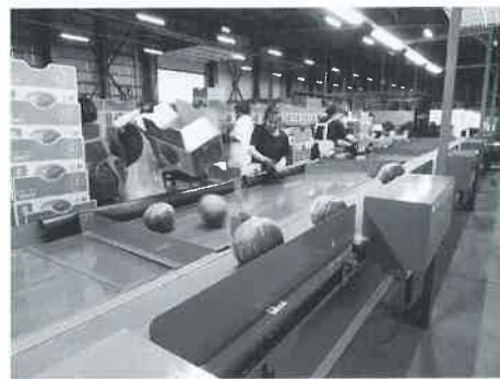
受入したかぼちやを選別する様子