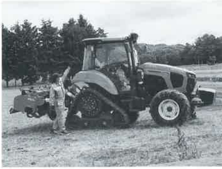
トラクターについて説明するクボタ担当者