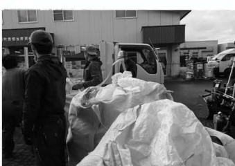
青年部農業容器回収