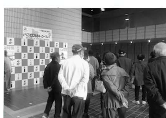
年金友の会研修旅行