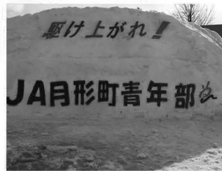
スノーメッセージ