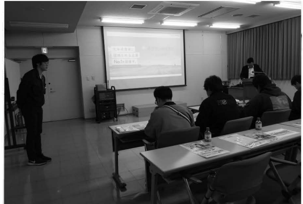
農協青年部町外視察研修実施