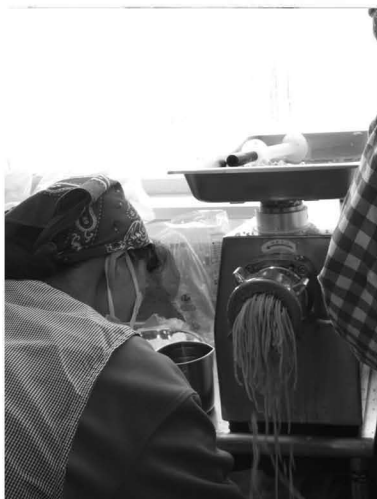
JA女性部味噌作り実施