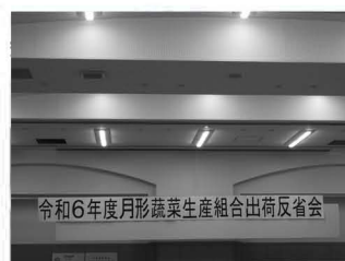
令和6年度月形蔬菜生産組合出荷反省会