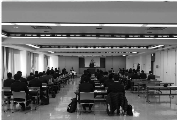
空知農協青年部南部ブロック会議青年部大会開催