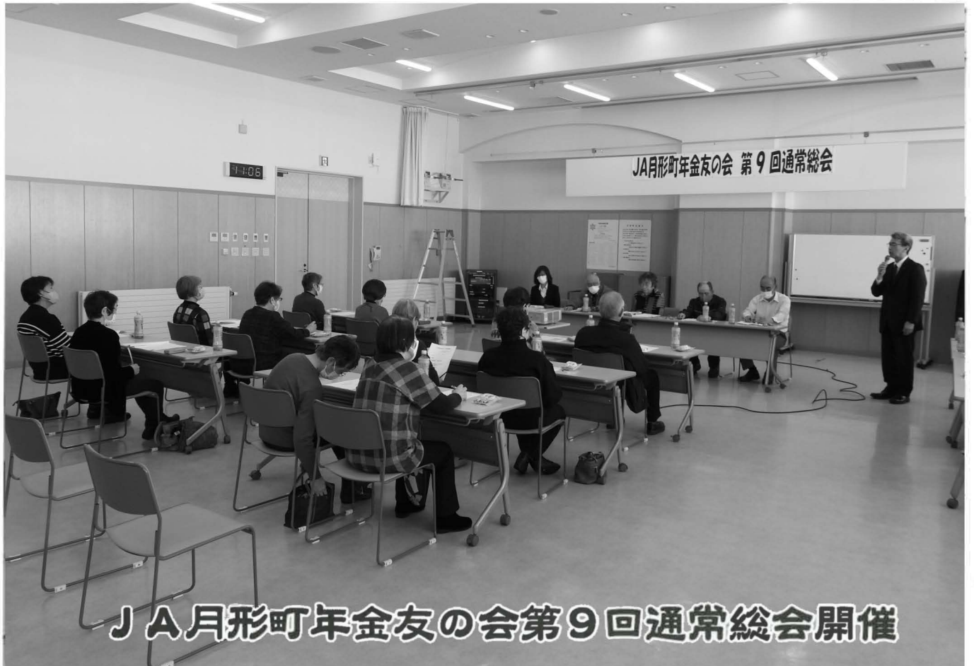
JA月形町年金友の会第9回通常総会開催