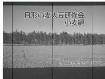
小麦・大豆生産組合栽培講習会