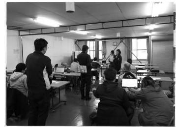
農業士会生産原価分析研修会