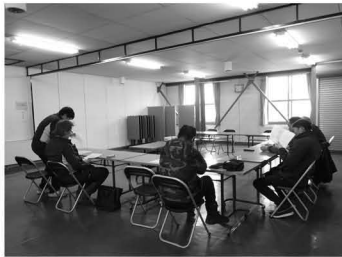
ゆめぴりか生産部会全体会議