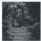
暑くて、半日陰を生かした美しい庭づくり